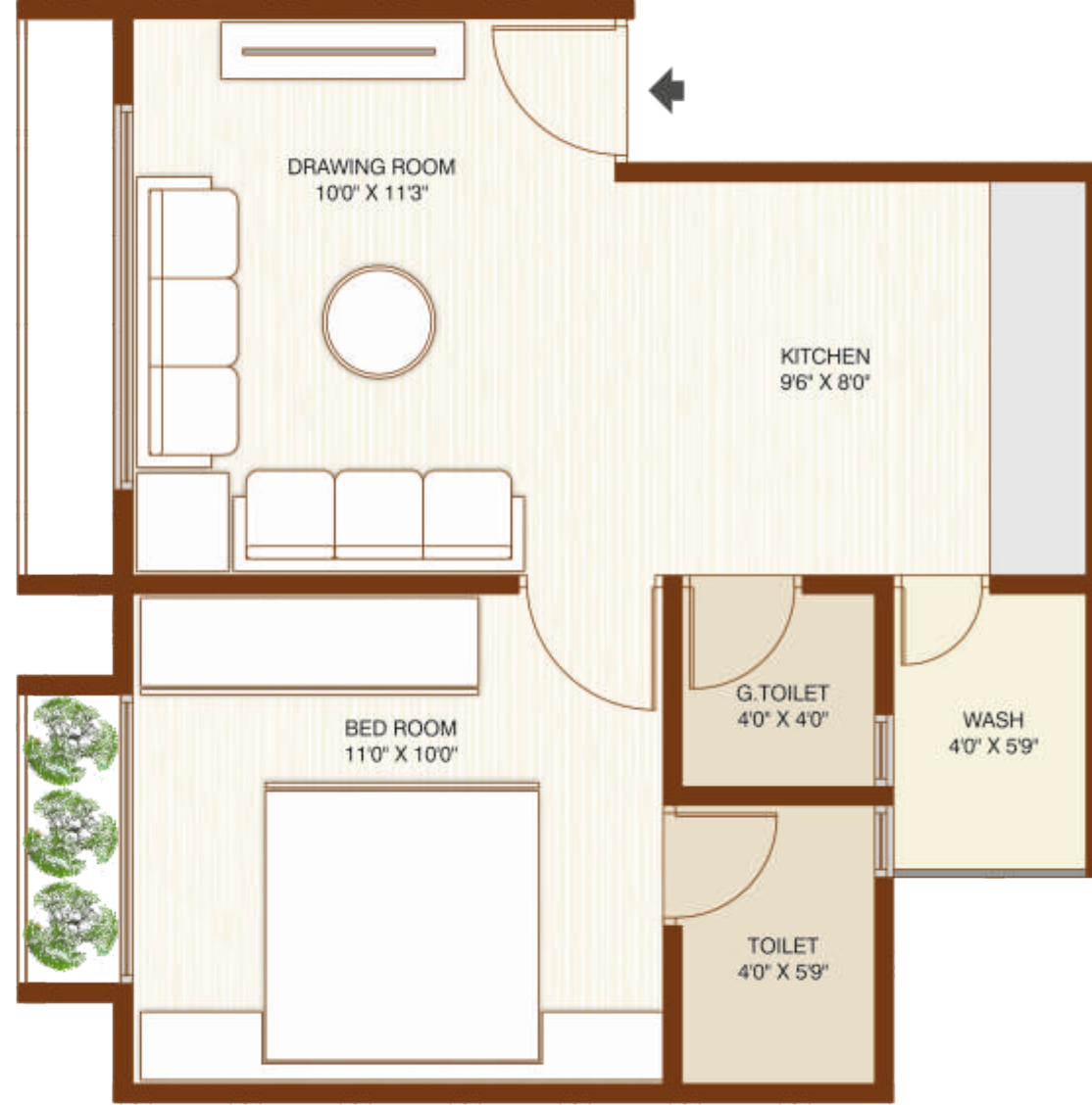
BLOCK B & C